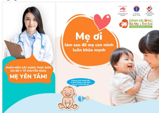
Mặt ngoài tờ gấp