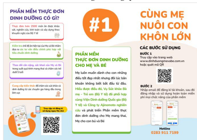
Mặt trong tờ gấp